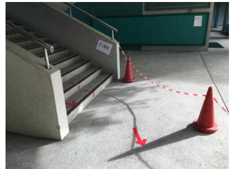
上り専用階段 【ソーシャルディスタンスのための動線の確保】 下り専用階段