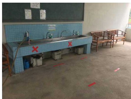
手洗い場のマーキング