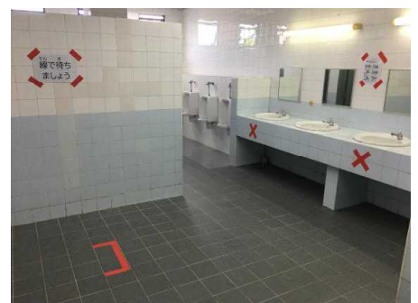
トイレのマーキング