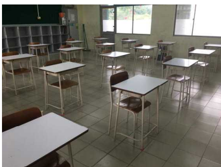
机の位置のマーキング