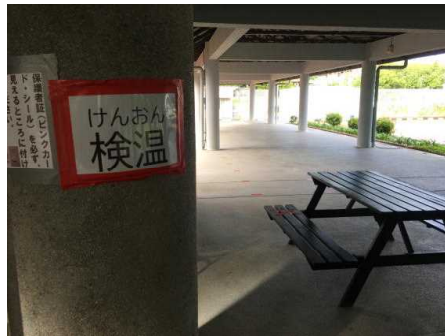
登校後の検温場所