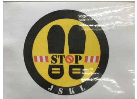
JSKL オリジナル のストップマーク