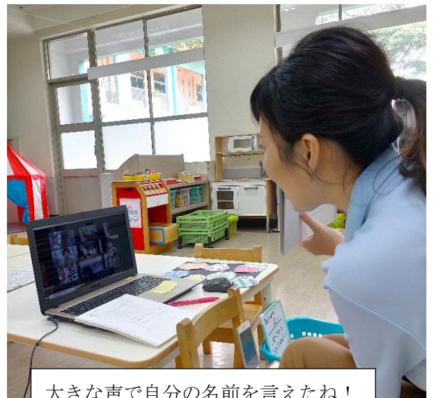
大きな声で自分の名前を言えたね！