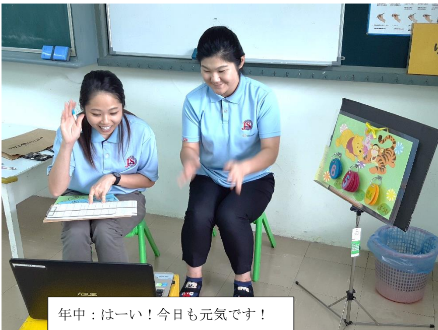
年中：はい！今日も元気です！