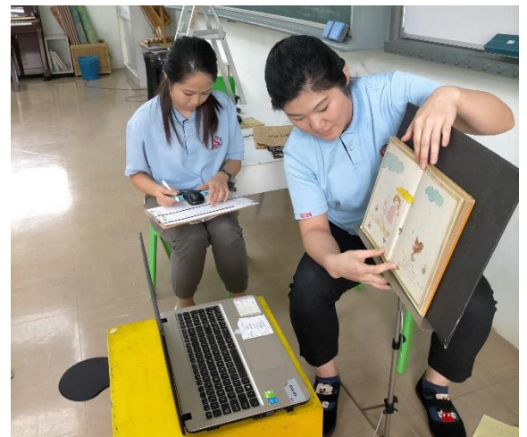
今日は絵本「小さな黄色いかさ」の読み聞かせです。みんなしっかり聞いています。