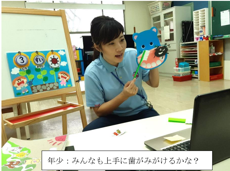
年少：みんなも上手に歯がみがけるかな？

※zoom は定期的にバージョンが更新されます。アップデートの確認をよろしくお願ひします。