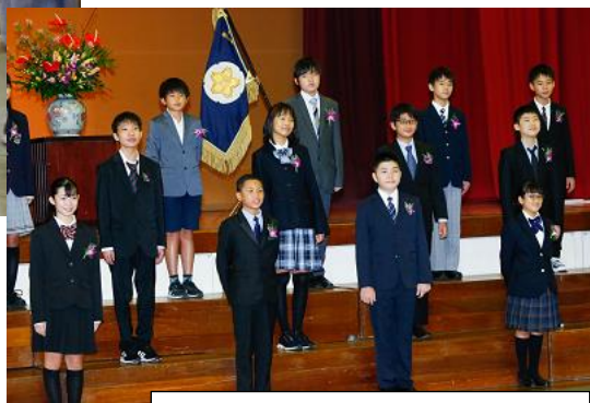
中学部入学式のようす 4.17

新学期がスタートし2週間が過ぎました。入学した、進級した子供たちの「やる気」が、毎日ひしひしと伝わってきます。