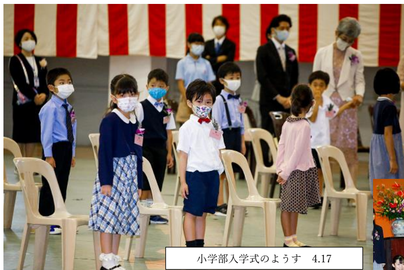
小学部入学式のようす 4.17

新1年生を迎える会、28日に中学部「新入生歓迎会」が開かれました。密を避けるため Zoom での行事となりましたが、 新1年生を迎える会、28日に中学部「新入生歓迎会」が開かれました。密を避けるため Zoom での行事となりましたが、